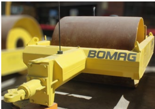
Rodillo Vibrador BOMAG BW 6

Los rodillos remolcados fueron desarrollados exclusivamente para la compactación de movimiento de tierras; sus parámetros como frecuencia, amplitud y masa vibratoria fueron diseñados para compactar en pendientes. El bastidor de acero sobre el suelo junto con el motor diesel colocado transversalmente, permiten trabajos de compactación en pendientes de hasta 40 grados. Asimismo, las rolas de tiro requieren un bajo costo de mantenimiento.